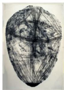
[monologue] コラグラフ、紙 1989年