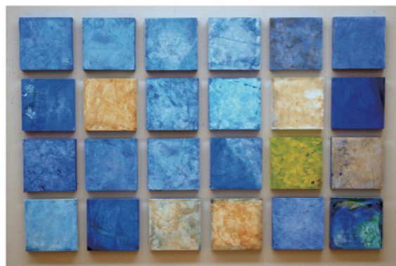
[断片] アクリル、パネル 2013年