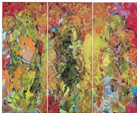
[Composition] アクリル、パネル 1996年