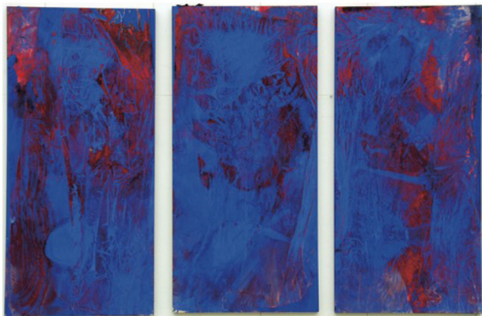
[Works-2004] アクリル、パネル 2004年