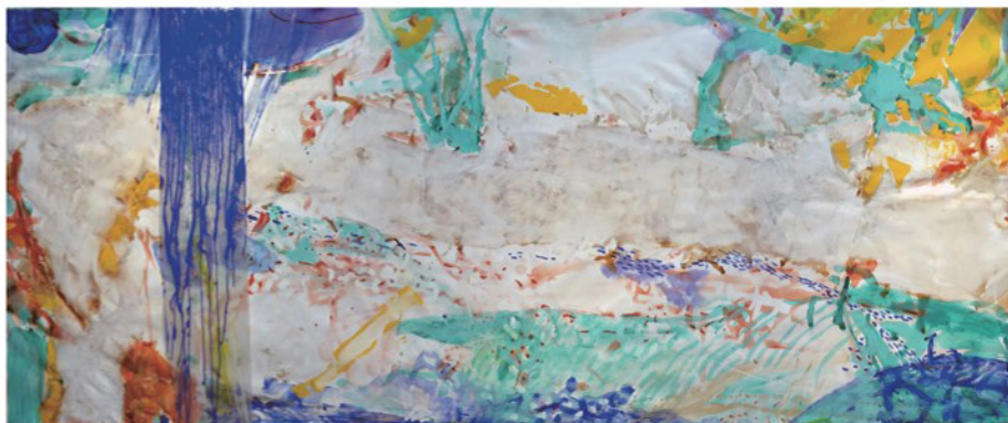
[Landscape] アクリル、キャンバス 2018年

退任記念となる本展は絵画、版画、コラージュ、オブジェなど多様な表現技法による作品群で構成されます。新作も交え、長年にわたる創作活動の軌跡を俯瞰する展示となります。